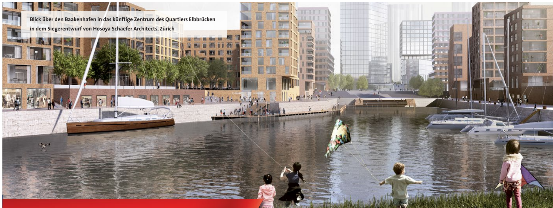
Blick über den Baakenhafen in das künftige Zentrum des Quartiers Elbbrücken in dem Siegerentwurf von Hosoya Schaefer Architects, Zürich